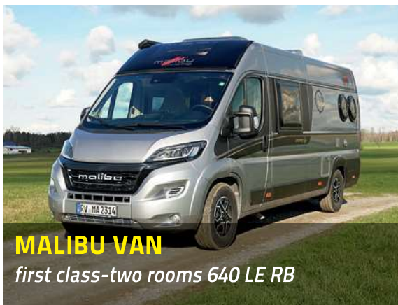
MALIBU VAN first class-two rooms 640 LE RB