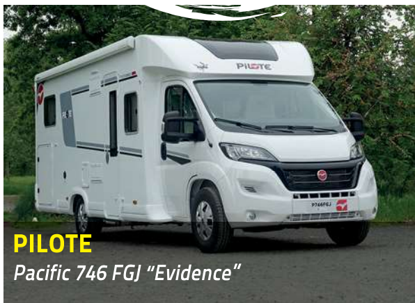
PILOTE Pacific 746 FGJ "Evidence"